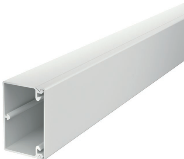
Kanaloverdel og -underdel med bundperforering.